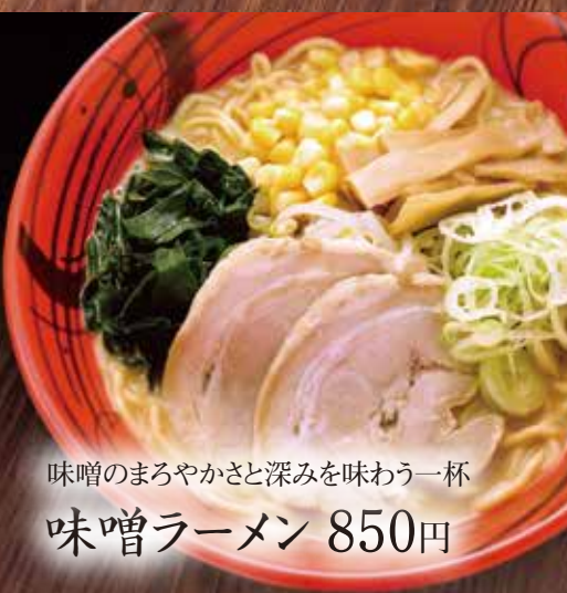
味噌のまろやかさと深みを味わう一杯 味噌ラーメン 850円