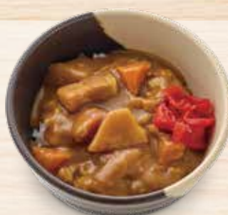
ミニカレーライス