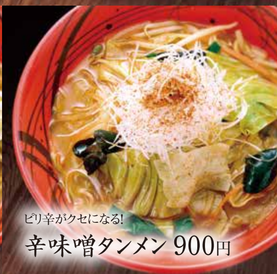
ピリ辛がクセになる！ 辛味噌タンメン 900円