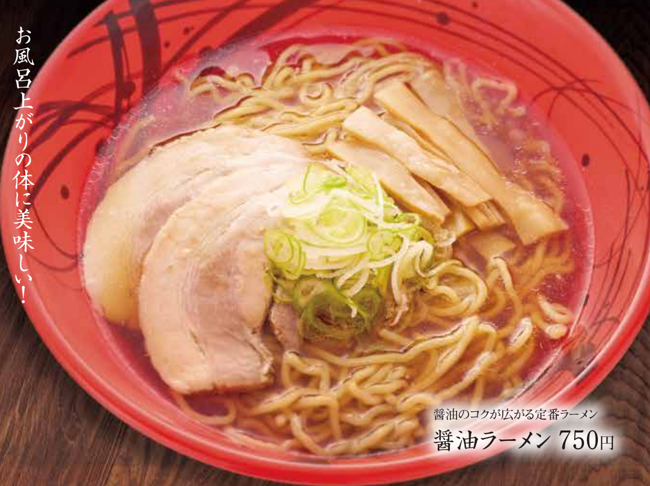
醤油のコクが広がる定番ラーメン 醤油ラーメン 750円