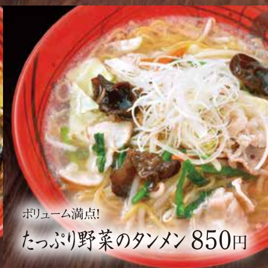
ボリューム満点！ たっぷり野菜のタンメン 850円